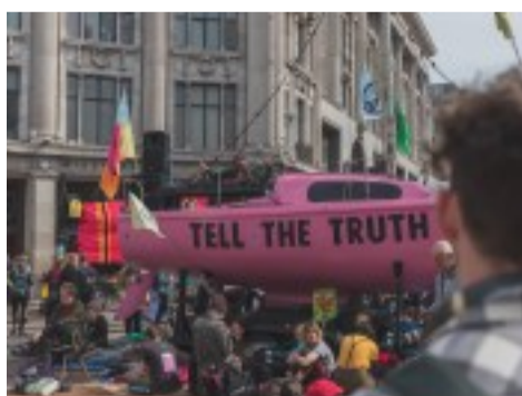
Er is geen klimaatcrisis