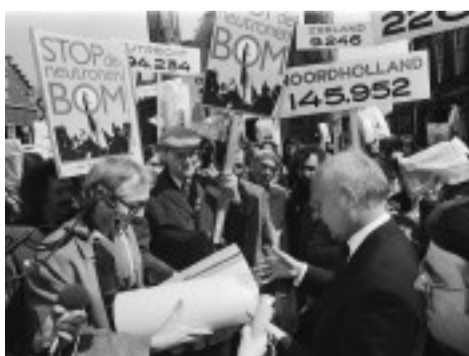
Doemdenken is weer hip