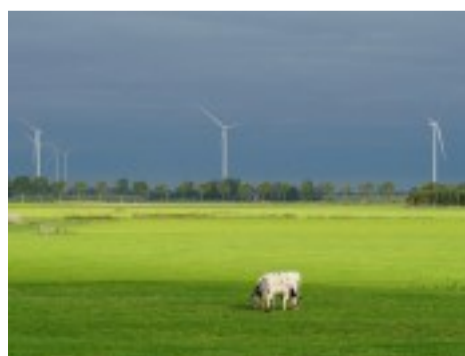
Stikstof heeft een E-nummer en is geen broeikasgas